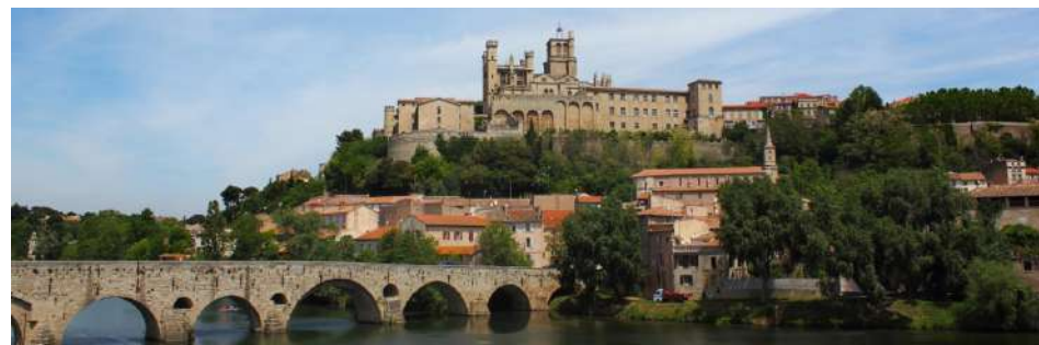
Béziers : L'Orb, le Pont Vieux et la cathédrale Saint-Nazaire

5 Traverser l'avenue Maréchal Joffre et entrer dans le jardin public, le Plateau des Poètes. Descendre en suivant le cheminement principal jusqu'au monument aux morts, traverser le tunnel puis rejoindre la gare.