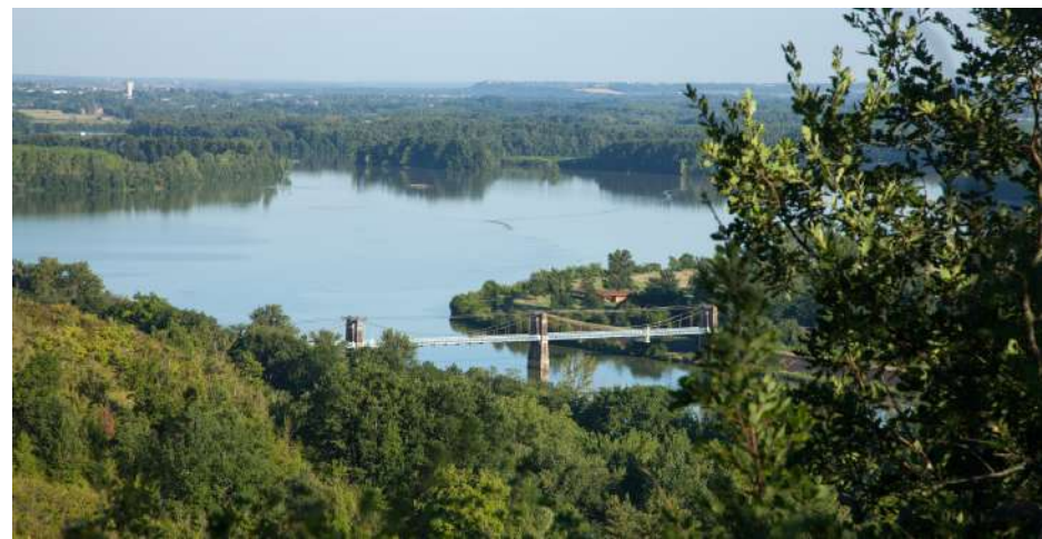
Plan d'eau de Saint-Nicolas de la Grave, confluent du Tarn et de la Garonne