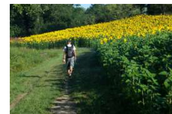
Campagne autour de Boudou