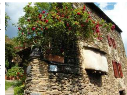
Maison d'Evoul et four à pain

2 Continuer tout droit et pénétrer rapidement dans le village. Passer devant la maison natale de Ludovic Massé (à gauche de la route - plaque sur la façade) puis, juste après le virage, monter à droite la ruelle pavée (Carrer del Reganet). En haut, prendre à gauche le Carrer del Barreil qui conduit à la Plaça del Cuiner. Poursuivre par le Carrer Barbeblanc (fours à pain) qui amène à la Plaça Ludovic Massé. 100 m plus loin, un petit chemin dallé permet d'accéder à l'église Saint-André (XI ème siècle). De là, redescendre sur la route et la suivre jusqu'à un carrefour tout proche. Franchir le pont de pierres et s'engager à droite sur un sentier qui mène à la chapelle Saint-Etienne (XIII ème siècle). Passer devant la chapelle, rejoindre la route et la suivre vers la gauche sur 100 m. Là, trouver à droite le sentier qui grimpe vers le château (XIII ème siècle).