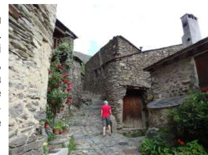
Ruelle du village d'Evoul

1 De la gare, prendre la série d'escaliers qui passe au pied de l'église Saint-André et rejoindre la place du village. La traverser pour emprunter la rue de la Libération qui monte à gauche. 200 m plus loin, juste avant un parking, s'engager dans une petite ruelle qui monte à droite. La suivre sur 100 m puis poursuivre par le chemin qui grimpe à gauche. Après avoir franchi le canal d'irrigation, le sentier chemine à flanc, en surplomb de la vallée de la rivière d'Évol, avant de déboucher sur la RD 4.