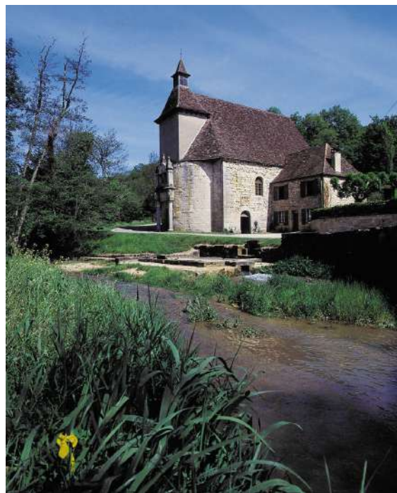
Notre Dame des Neiges