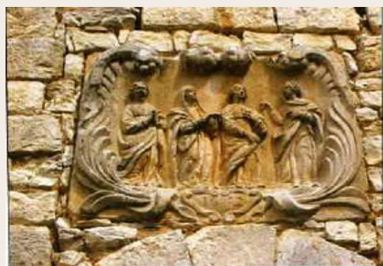
Bas-relief de la chapelle Notre-Dame-des-Neiges

neige le lendemain matin. Ainsi fut fait. En souvenir du miracle survenu à Rome, de nombreux édifices religieux ont depuis été baptisés Notre-Dame-des-Neiges. A Gourdon, c'est en lieu et place d'une source miraculeuse fréquentée depuis le XIIIe siècle par les pèlerins de Saint-Jacques-de-Compostelle que fut bâtie au XIVe siècle la chapelle Notre-Dame-des-Neiges. Elle abrite un magistral maître-autel du XVIIe siècle, oeuvre majeure des sculpteurs Tournié